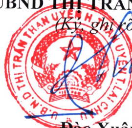
Đào Xuân Nhật